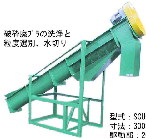
破砕廃物の洗浄と 粒度選別、水切り

型式：HPSCU20 寸法：210φ-2400mm 駆動部：200V-0.75~2.2KW 用途：建設材料供給用