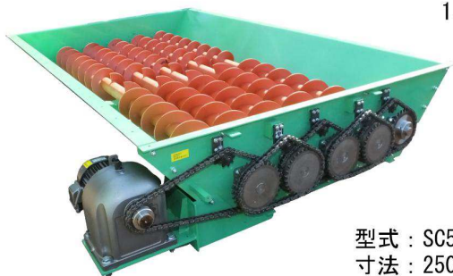
実際はスクリーの上に 1500φのトンネルがあります

型式：SC5U25330-5 寸法：250φ-3300mm 駆動部：200V-3.7KW 用途：トンネルアンダー材の受用 材料：パーク堆肥